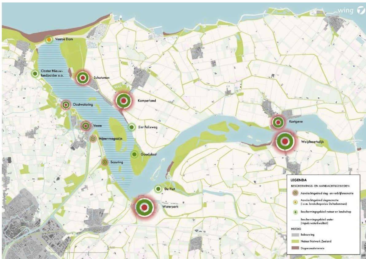
Kaart uit Gebiedsvisie Veerse Meer 2020-2030, Besluitvormingsnotitie fase 1: Globale situering van de rode en oranje aandachtsgebieden en de groene en blauwe beschermingsgebieden.

In de tweede fase zullen de algemene principes uit fase 1 verder worden uitgewerkt en zal er van elk aandachtsgebied een streefbeeld worden gemaakt. Voor het waterpark is dat anders dan voor de andere aandachtsgebieden omdat er al een inrichtingsplan is. Er zal dan ook vooral worden gekeken naar de directe omgeving van het waterpark. Vragen die aan de orde zullen komen zijn bijvoorbeeld: