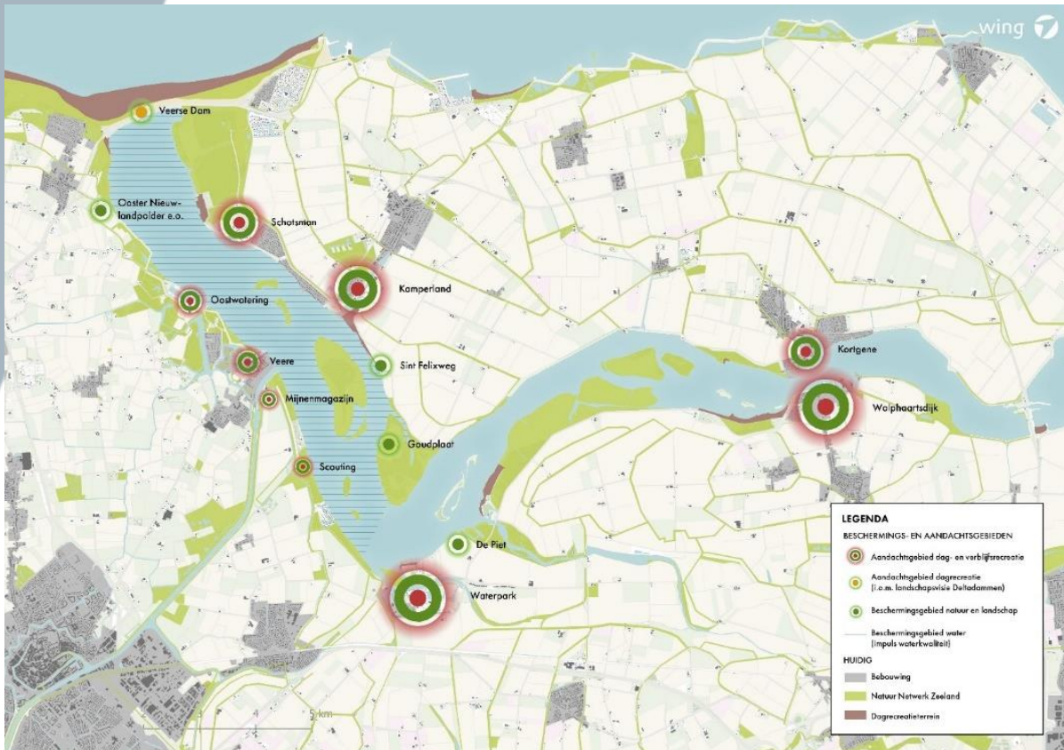
Kaart uit Gebiedsvisie Veerse Meer 2020-2030, Besluitvormingsnotitie fase 1: Globale situering van de rode en oranje aandachtsgebieden en de groene en blauwe beschermingsgebieden.

In de tweede fase worden de algemene principes uit fase 1 verder uitgewerkt en zal er van elk aandachtsgebied een streefbeeld worden gemaakt. Voor het waterpark is dat anders dan voor de andere aandachtsgebieden omdat het een “pijplijnproject” is en er al een inrichtingsplan is. Er zal dan ook vooral worden gekeken naar de directe omgeving van het waterpark. Vragen die aan de orde zullen komen zijn bijvoorbeeld: